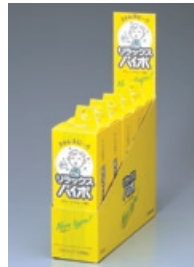
リラックスパイポ

この結果、当連結会計年度の健康食品関連事業の業績は、売上高が1,718百万円、営業利益が36百万円となりました。