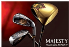
マジェスティ・プレステジオ・スーパーセブン

当連結会計年度の国内ゴルフ事業の業績は、売上高が2,630百万円、営業損失は24百万円となりました。